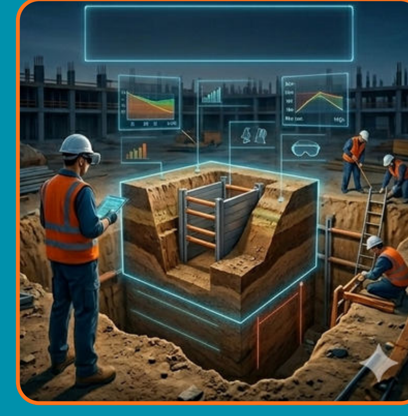
BEZPEČNOST PŘI VÝKOPECH A ZEMNÍCH PRACÍCH

ŠKOLENÍ BOZP PROSTŘEDNICTVÍM VR JE EFEKTIVNÍM DOPLŇKOVÝM NÁSTROJEM PRO TRADIČNÍ FORMY VZDĚLÁVÁNÍ V OBLASTI PREVENCE RIZIK.