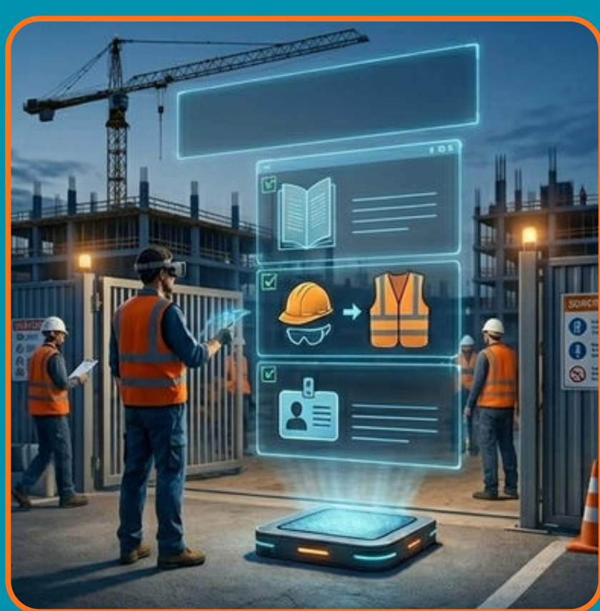
ZÁSADY A PRAVIDLA PRO VSTUP NA STAVENIŠTĚ