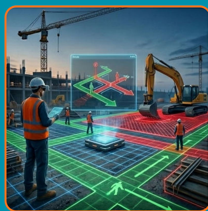
BEZPEČNÝ POHYB OSOB A MECHANIZACE NA STAVENIŠTI