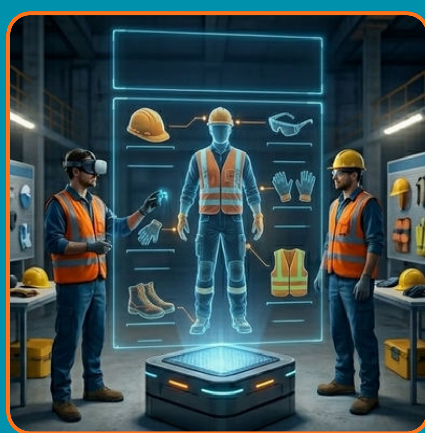
ZÁSADY POUŽITÍ OOPP NA STAVENIŠTI